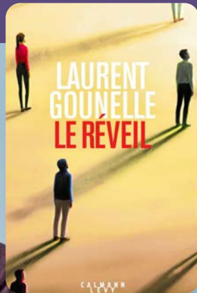
Le réveil, L. Gounelle (Calmann-Lévy, 2022)